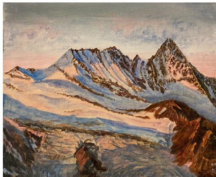
Acryl; Abendsonne an der Glockner-Südseite

Am Gang der Amtsräume im ersten Stock des Gemeindeamtes sind vier Bilder (zwei Acrylbilder und zwei Aquarellbilder) des Dietacher Künstlers Ing. Günther Nagenkögl ausgestellt und können zu den Öffnungszeiten des Gemeindeamtes bewundert werden. Vielen Dank an Herrn Nagenkögl für die Ausstellung seiner Werke.